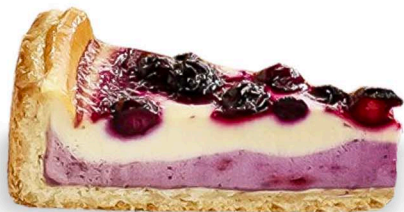
VEGAN BLUEBERRY CAKE* 6€ cheesecake vegana ai mirtilli servita con frutti di bosco